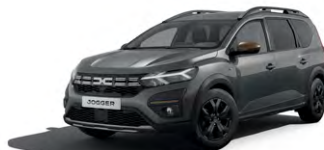
ŠEDÁ SCHISTE (1)