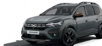
ŠEDÁ URBAN (2)