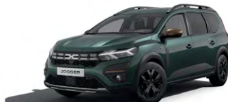
ZELENÁ ČĚDRE (1)