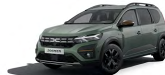
ZELENÁ DUSTY (2)