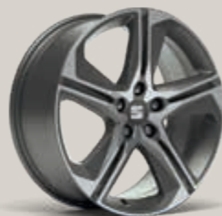
SPORT 18" FR