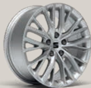
DYNAMIC I 17" XC