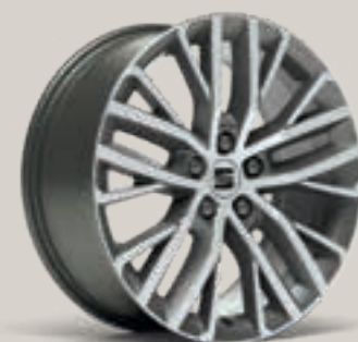
PERFORMANCE I 18" XC