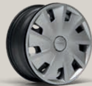
URBAN 15" R