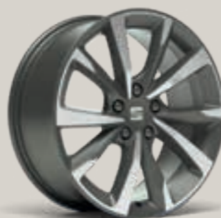
PERFORMANCE II 18" FR