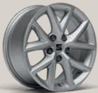
DESIGN 16" R St