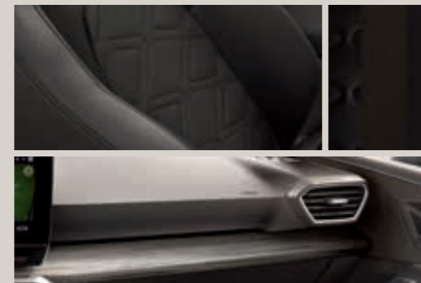
KŮŽE NAPPA XCELLENCE