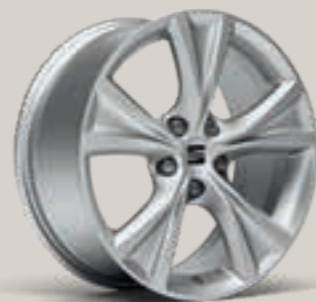
DYNAMIC II 17" FR