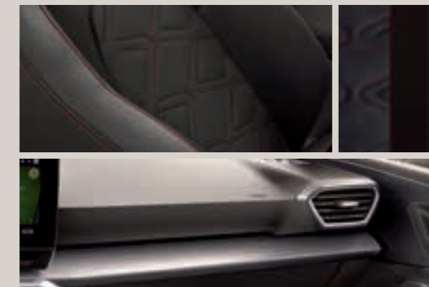
KŮŽE NAPPA FR