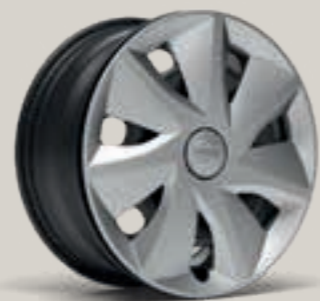
URBAN 16" R